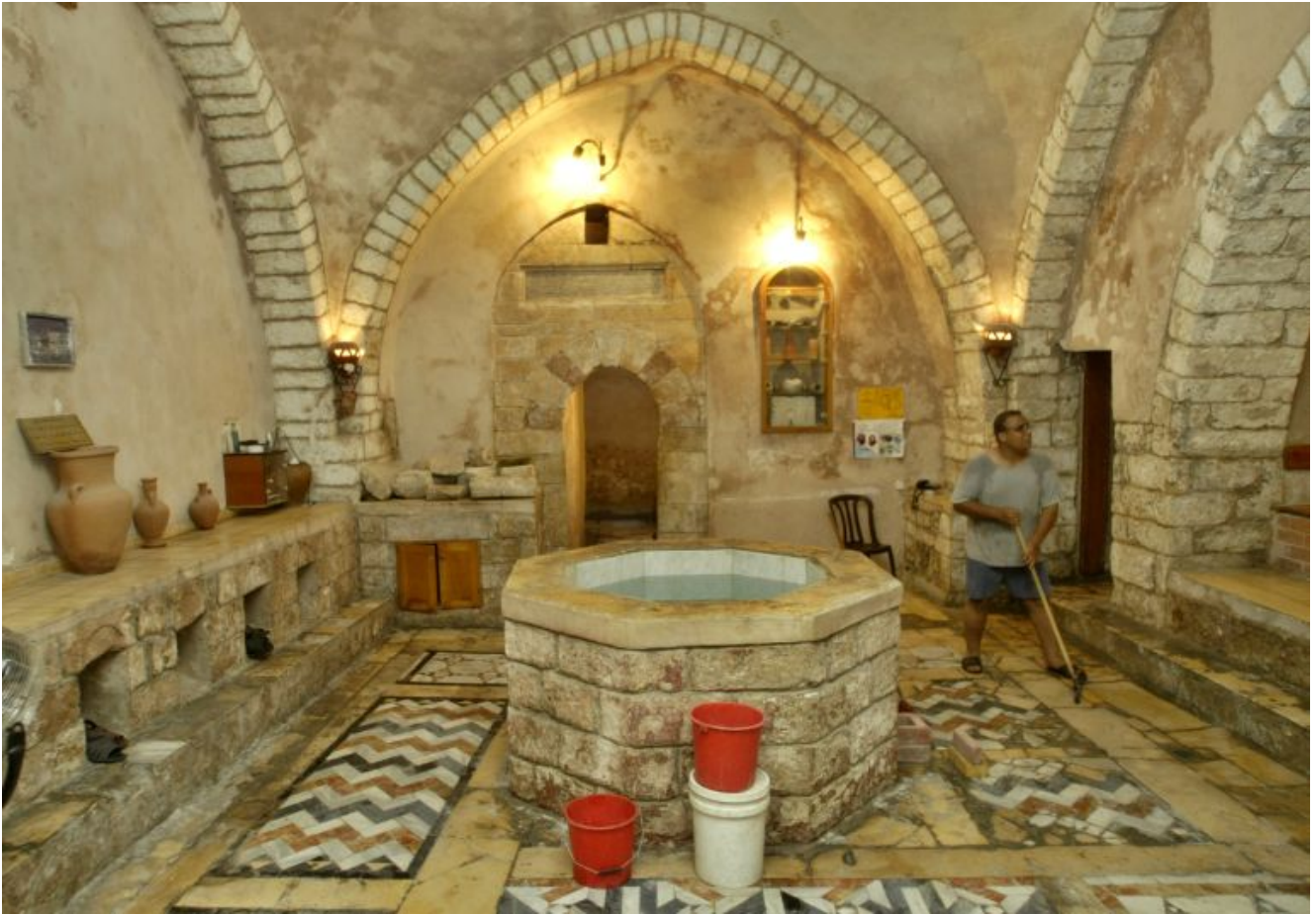
L'Hamman al-Sammara .Foto: Ahmed Jadallah/Reuters

L'hammam al-Sammara era l'ultimo rimasto. Una volta un cartello all'ingresso diceva che era stato restaurato nel 1320 dal governatore mamelucco Sangar ibn Abdullah.