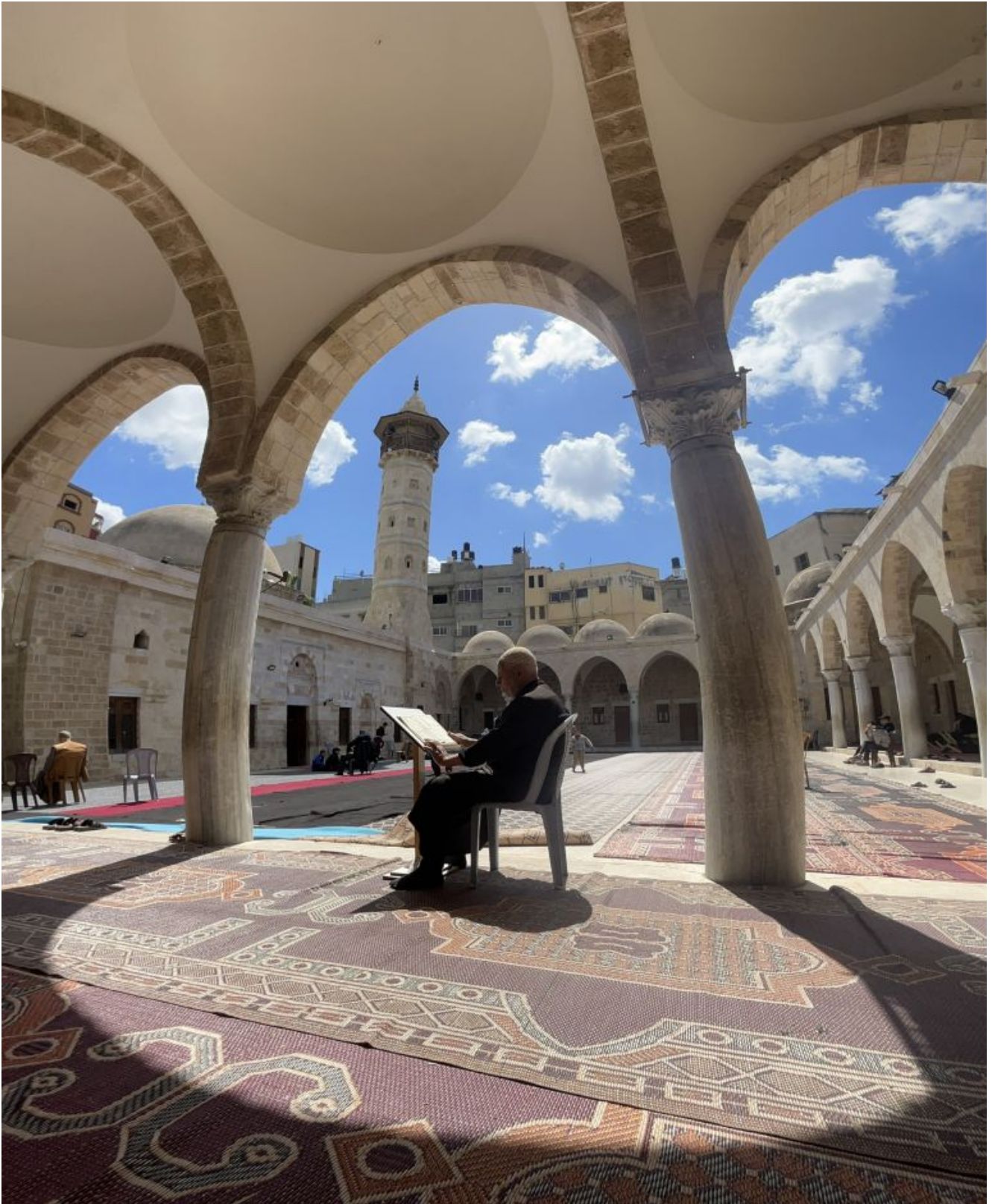
La Moschea Hashim bin Abd Manaf.

Alla costruzione della moschea fece seguito un breve intervallo di dominio crociato prima che si insediassero al potere i Mamelucchi che la ricostruirono. Fu in seguito restaurata nel 1850 sotto la guida del sultano ottomano Abdul Majide e di nuovo dopo i danni nel 1917 durante la prima guerra mondiale.