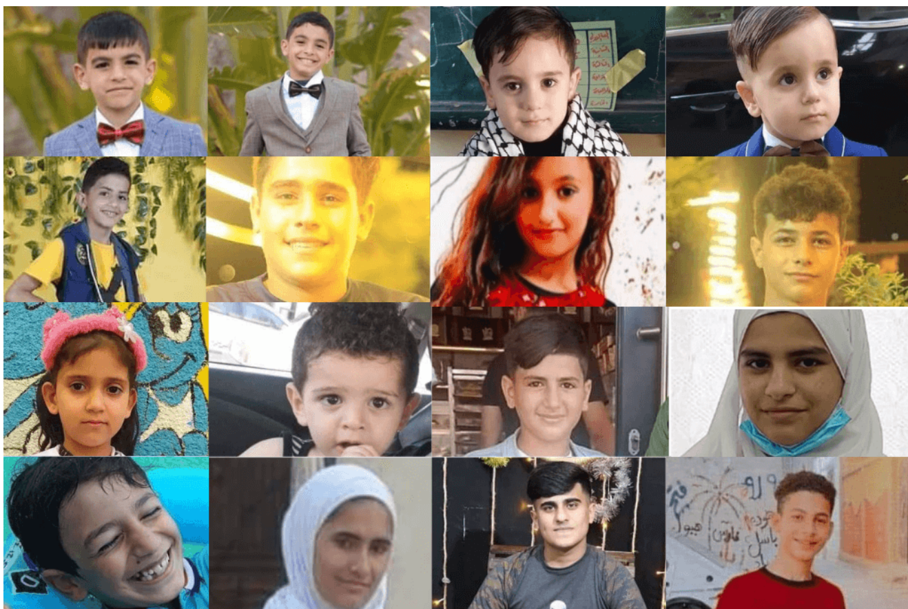
I sedici minori uccisi a Gaza nell'attacco di questa estate

Israele quest'anno ha ucciso a colpi di arma da fuoco 23 minori palestinesi nella Cisgiordania occupata nell'impunità totale, e ad agosto ha ucciso 17 minori a Gaza, il tutto in attacchi deliberati condotti per lo più con armi statunitensi.