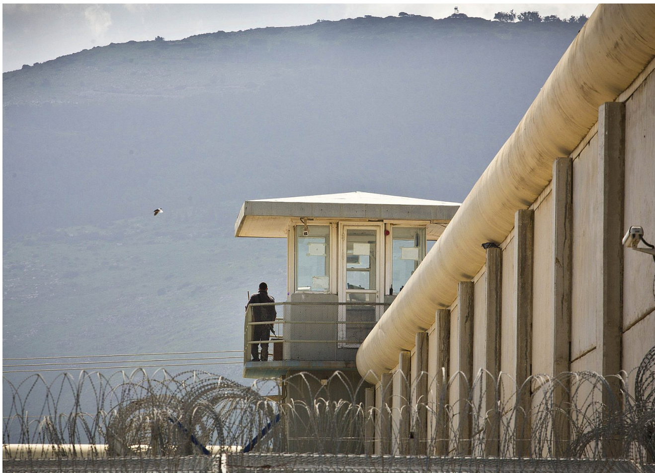
La torre di guardia della prigione Gilboa

sospetti di comportamenti delittuosi. Nel corso degli anni sono state vagliate dal dipartimento centinaia di denunce; in tutti i casi tranne uno il dipartimento ha concluso che non ci fossero sospetti di comportamento scorretto e li ha archiviati.